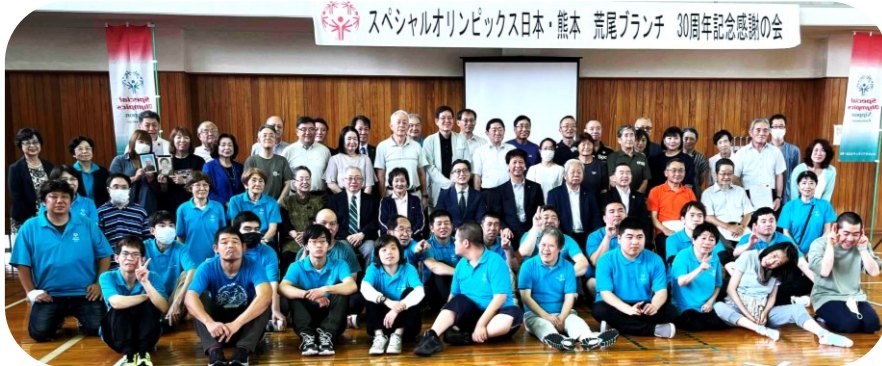
スペシャルオリンピックス日本・熊本 荒尾フランチ 30周年記念感謝の会