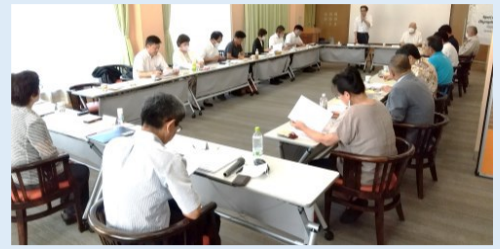
熊本機能病院の多目的ホール

また、今回は「熊本地震からの復興を祈念」とともに、多くの自然災害による被災者にエールを送る大会にもしたいとの思いから、益城町の被災や復興の状況等を大会参加者にどう視察いただくかについても意見が交わされました。