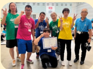
オハイエチームも出場