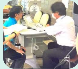
目の健康、視力検査と メガネ選び (メガネのヨネザワ)