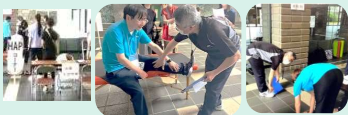
栄養・生活習慣相談、身体機能チェック (筋力・柔軟性) (熊本機能病院)