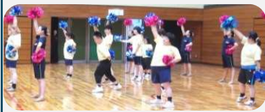
城北高校 チアダンス部の 皆さん &SON・熊本 チア競技