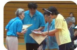
感謝の言葉と アスリートの 手作り記念品 が贈られた