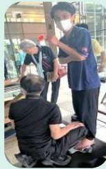
足の健康・測定 (ハヤカワスポーツ)