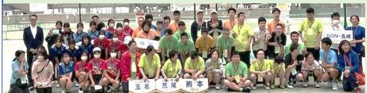
福岡と長崎からもシングルス、ダブルス、個人技能競技に参加。