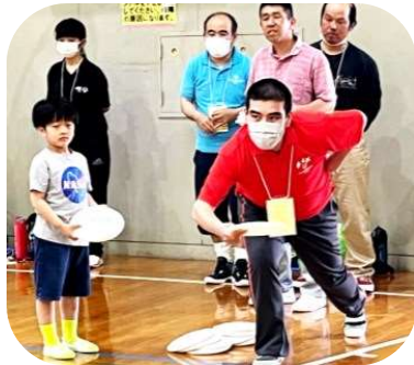
最年少のボランティアさん