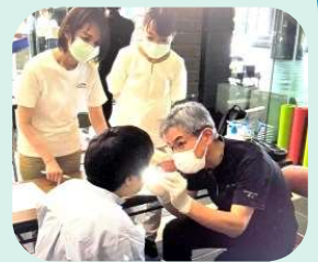
口腔検査 (あかほし歯科)