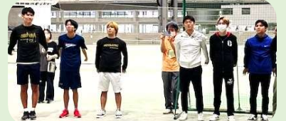
万歳隊の熊本保健科学大学生 熊本総合医療リハビリテーション学院生