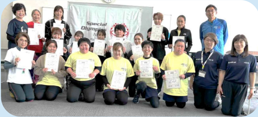
参加者13人が修了書と参加書を持って・・