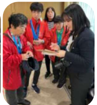
熊日の記者の インタビュー をうけるア スリート